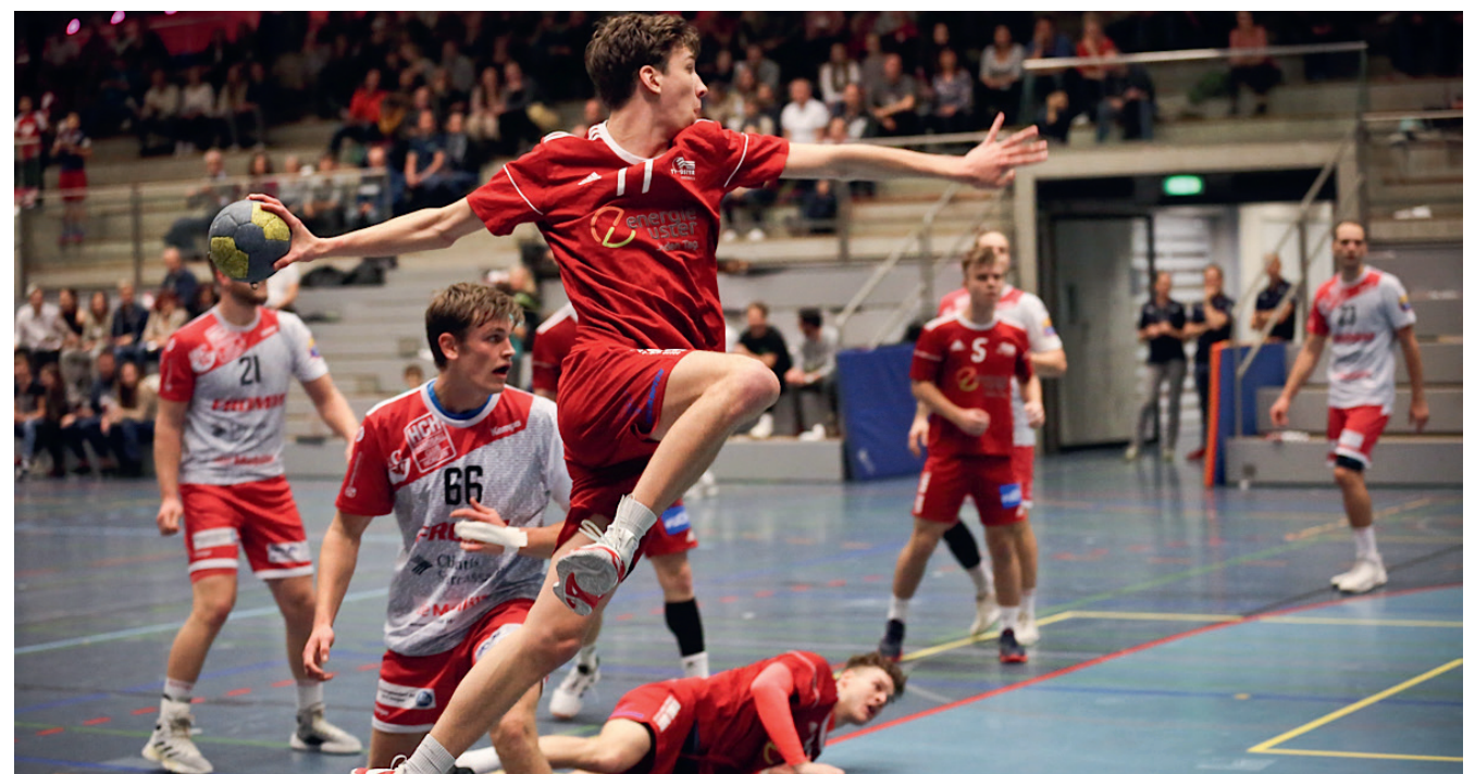
An den Bank BSU Uster Games werden wieder Tore geschossen