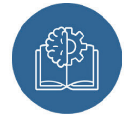
Bildung, Forschung und Innovation