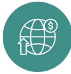
Wirtschafts- und Finanzsystem