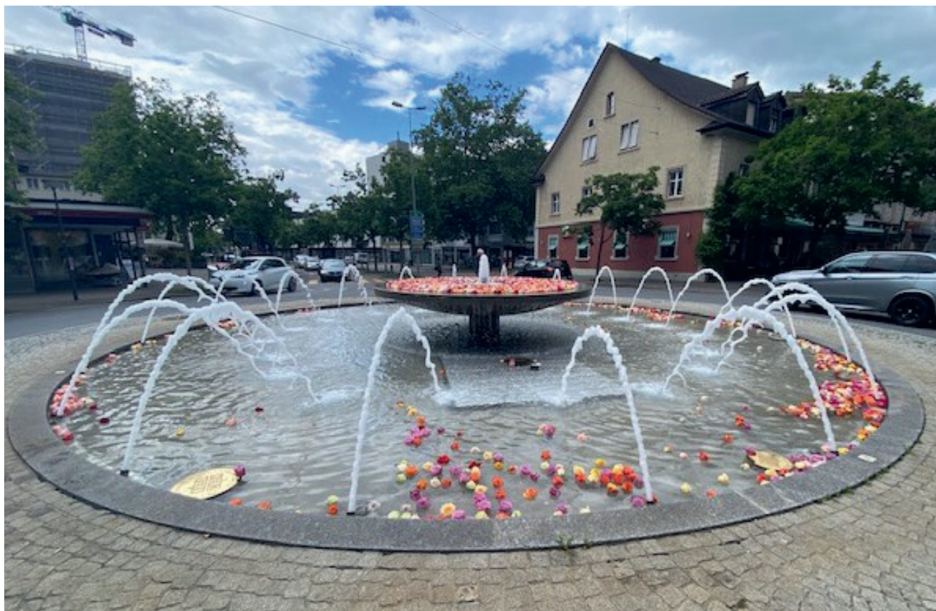
Der Brunnenkreisel steht auch für die Wasserstadt Uster

Ja, klar, auch andere Aspekte spielten eine Rolle: Die Lage des Brunnenkrei-