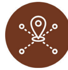
Raumentwicklung und Mobilität