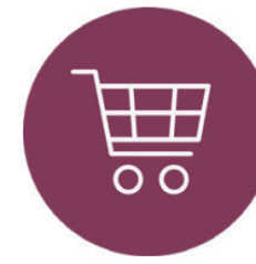
Produktion und Konsum