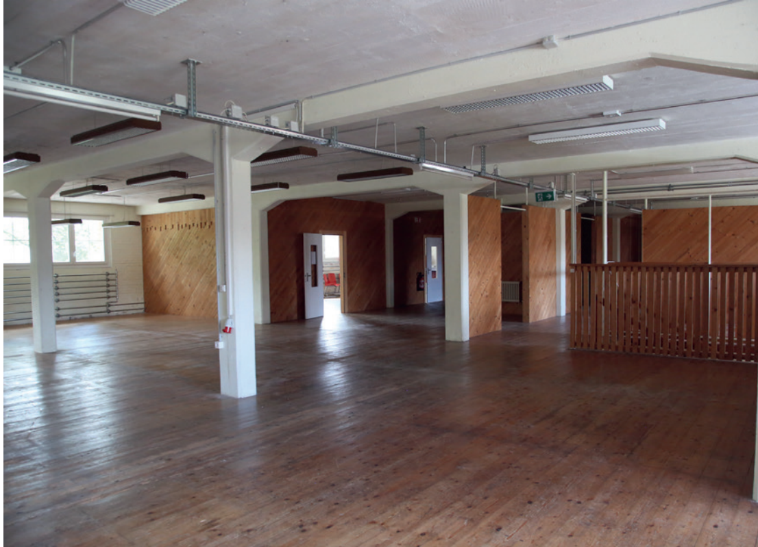
Kulturzentrum Zeughaus: erstes Obergeschoss im aktuellen Zustand

SJO, das Schweizer Jazz Archiv in Uster, ändert seine Strategie. Wer sich in über hundert Jahren Jazz in der Schweiz textlich, bildlich und akustisch orientieren will, findet seit Jahr und Tag in Uster breit gefächerte Auskunft. Das in der Oberländer Metropole angesiedelte und von einem Freiwilligenteam laufend aktualisierte Archiv Swissjazzorama (SJO) ist weit über die Landesgrenzen hinaus bekannt, heute aber an seinen Leistungslimiten angelangt. Die Zukunft heisst: Kooperation und Standortwechsel.