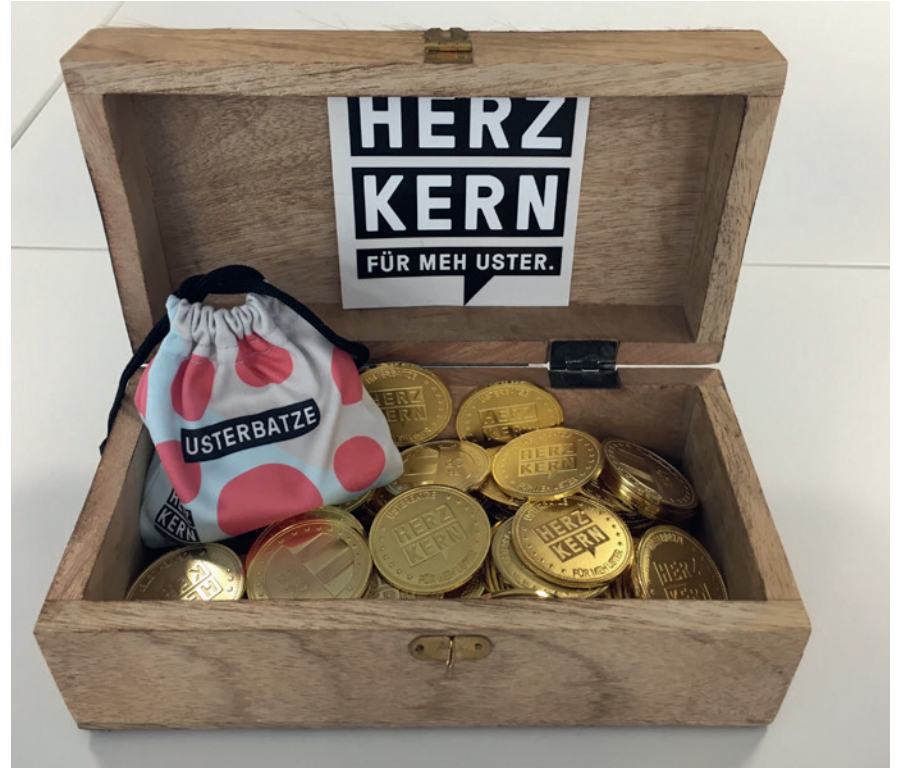
180 Geschäfte akzeptieren den UsterBatze

25 Franken ist ein UsterBatze wert. Die wunderschöne Goldmünze eignet sich ausgezeichnet als Weihnachtsgeschenk, sowohl für Einzelpersonen, die sie gerne an liebe Verwandte oder Freunde übergeben möchten, wie auch für Unternehmerinnen und Unternehmer, die ihren Mitarbeitenden originelle und wertvolle Weihnachtsgeschenke oder Dienstaltersgeschenke machen oder ein Dankeschön für einen besonderen Einsatz oder eine herausragende Leistung überreichen möchten. Es gibt unendlich viele Möglichkeiten, den UsterBatze einzusetzen. Beziehen kann man die UsterBatze bei Tschopp Optik an der Poststrasse 6 und bei 55° Nord an der Gerichtsstrasse 14 in Uster. Auf Wunsch in einem schmucken Geschenk-säckli.