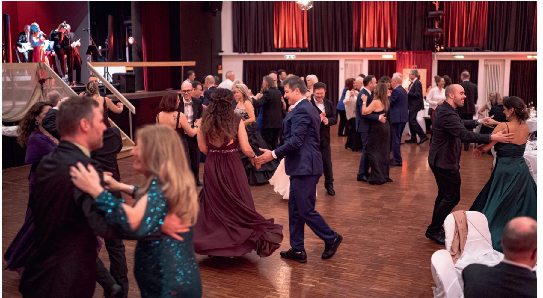
Am 13. Januar 2024 das Tanzbein schwingen

Mit dem Neujahrsball Uster starten traditionsgemäss Geniesserinnen und Geniesser aus der Region, Tanzfans und das lokale Gewerbe fulminant ins neue Jahr.