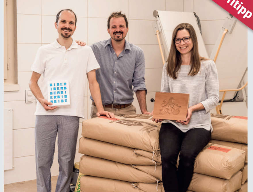
Das Team der Biber-Manufaktur Leibacher

Biber Manufaktur Illnau und Wermatswil 044 940 29 74 www.biber-manufaktur.ch