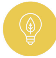
Energie und Klima