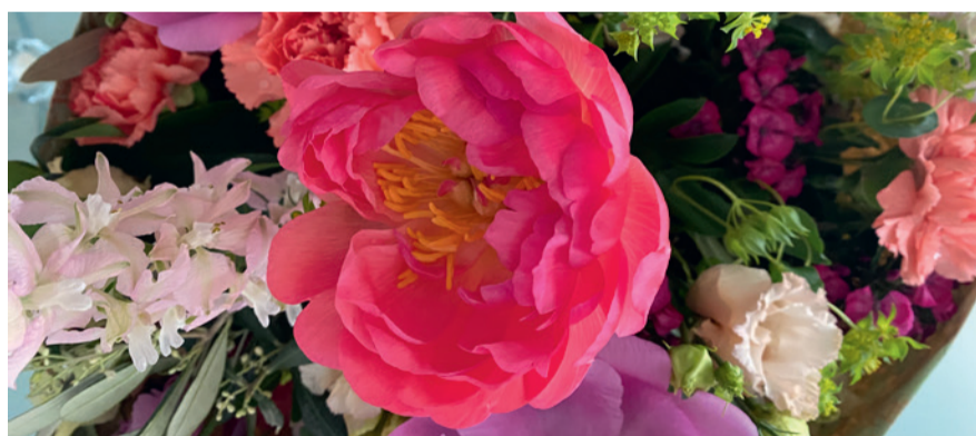
Herzkern sorgt für Farbe im Stadtzentrum