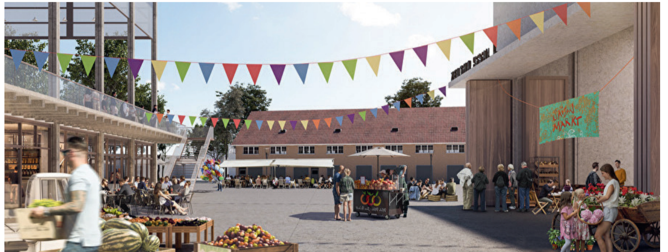
Zeughausareal: Abstimmung über Baukredit im Frühling 2024

Die AG muss mit ihren Organen (Verwaltungsrat, Geschäftsleitung und Beirat) neutral und ausgewogen alle Interessengruppen, inkl. das Gewerbe, abbilden. Es ist auf eine Verhinderung von Macht- bzw. Interessenkonzentration in allen Gremien zu achten. Das Ustermer Gewerbe muss zwingend Ein-