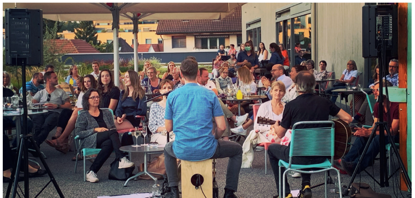
Gut besuchte Konzerte auf der Illuster-Dachterrasse

Alle Infos zu den Sessions und Tickets gibt es auf der Hotel-Illuster-Website: www.hotelilluster.ch .