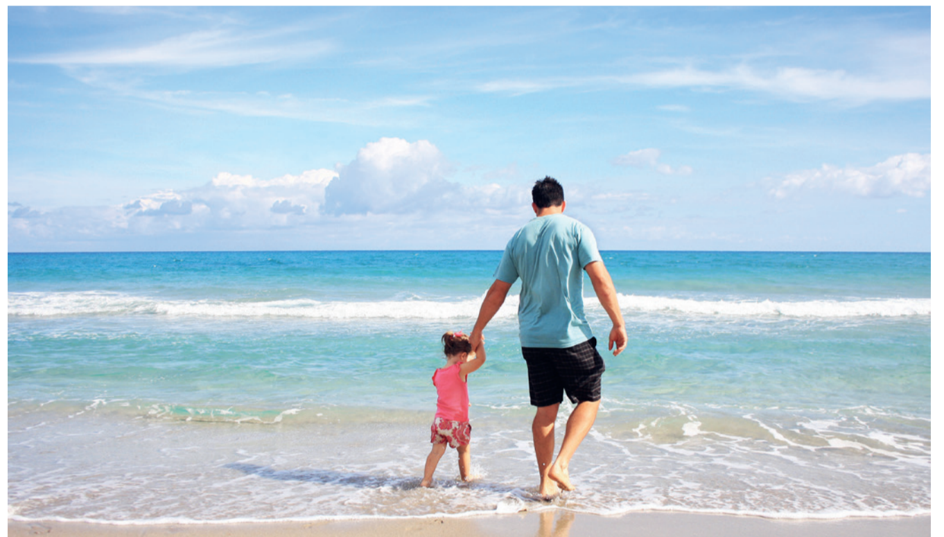
Ist Uster während der Ferien im Sommerloch?