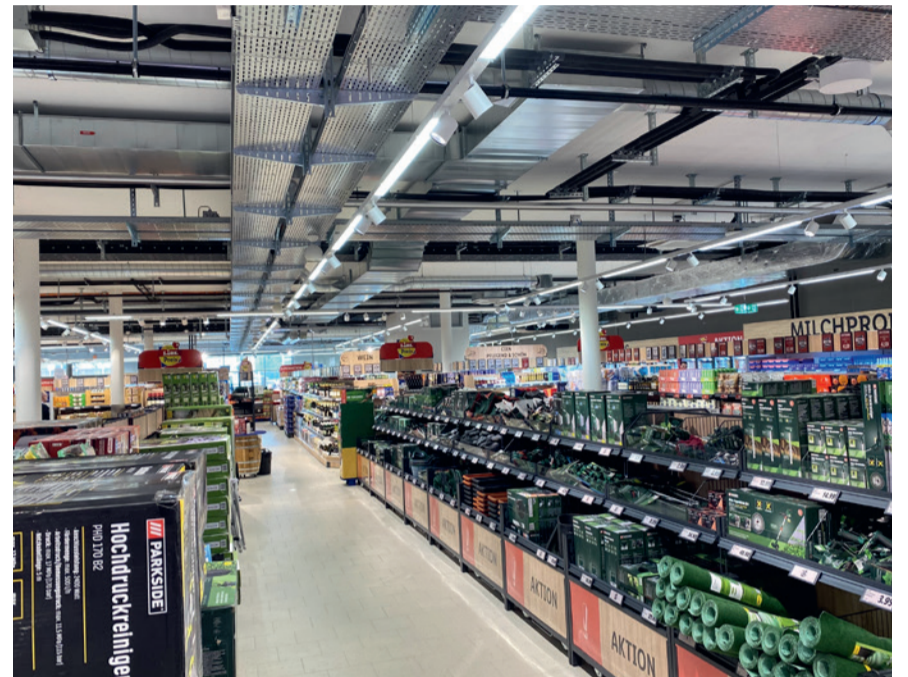
Lidl kommt nach Uster

Lidl Schweiz hat für die neue Filiale in Uster rund 3 Mio. CHF investiert. Für die Kundinnen und Kunden stehen 50 Parkplätze zur Verfügung. In der Lidl-Filiale wurde die neuste Technik verbaut. Um den Stromverbrauch zu reduzieren, wird die Filiale mit modernsten LED-Lampen beleuchtet. Das Herzstück ist eine moderne und effiziente Heizungs-, Lüftungs- und Klimaanlage. Die Filiale wird durch Wärmerückgewinnung geheizt und durch neuste Geothermietechnik gekühlt. Lidl Schweiz setzt natürliche