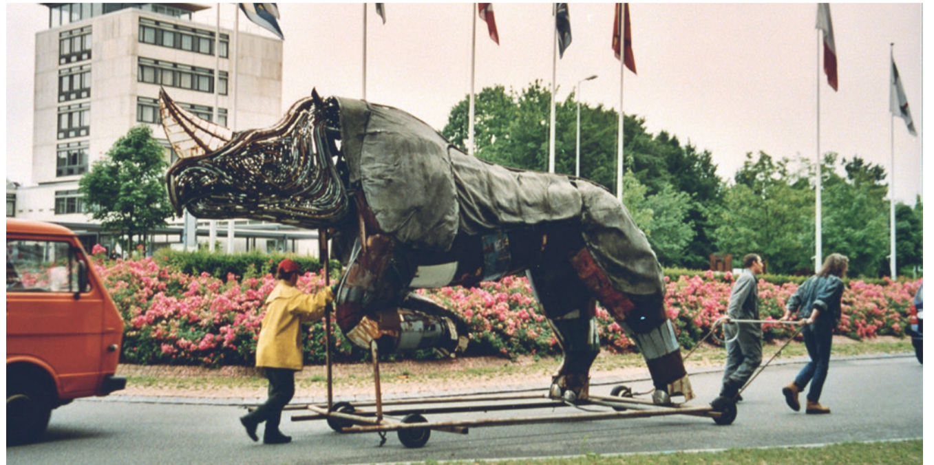
Das Nashorn wird vorübergehend abgezügelt

Was Nashörnern in Afrika nichts anhaben kann, wurde demjenigen in Uster zum Verhängnis: ein Sturm. Lothar