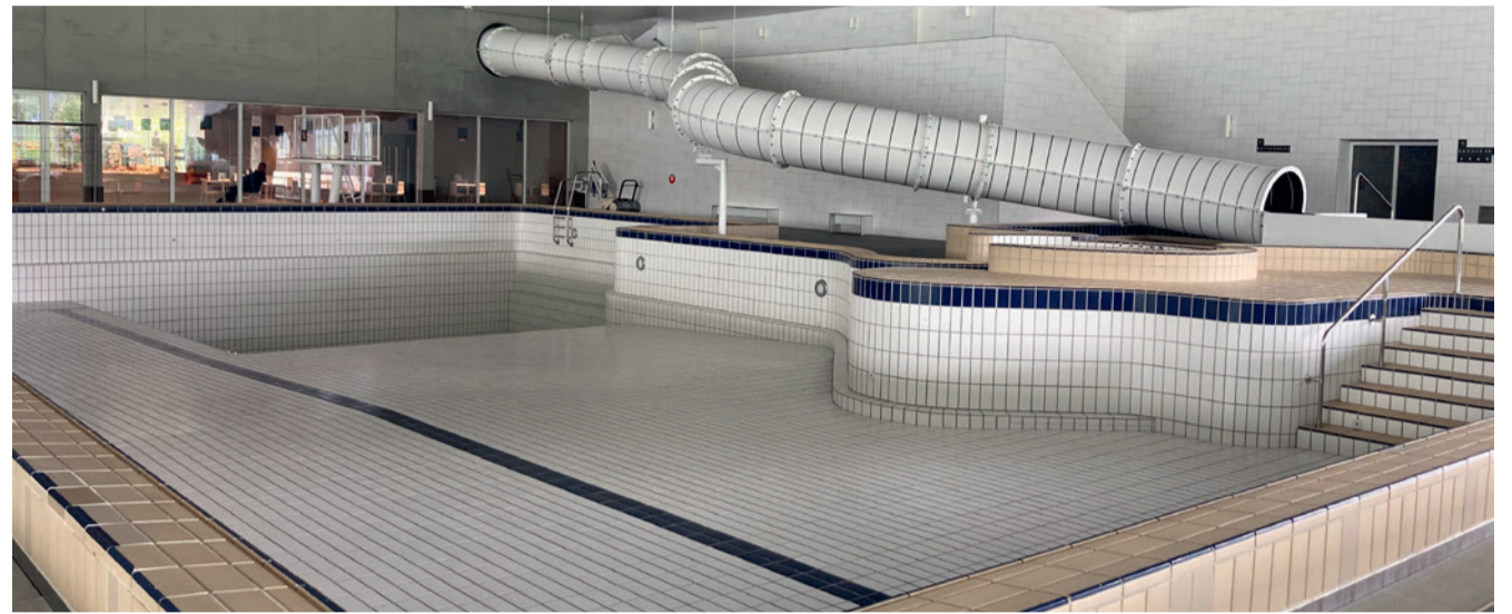
Leere Becken im Hallenbad Uster

Genau, das Hallenbad Uster bietet zahlreichen Sportvereinen eine ideale