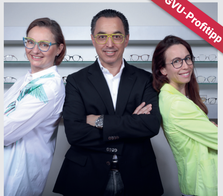
Die Brillenprofis von Diem Optik

Diem Optik Freiestrasse 3 8610 Uster 044 940 18 11 www.diemoptik.ch