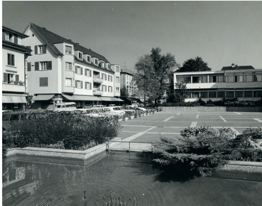
Der zweite Standort an der Bahnhofstrasse 12; aufgenommen 1966 von Fritz Bernhard.

Das Stadtarchiv Uster sammelt und bewahrt das historische Archiv der Stadt sowie zahlreiche Privat- und Firmenarchive. Ergänzt werden sie durch die Bestände der Paul-Kläui-Bibliothek und die Sammlung lokaler Kunstwerke. Bislang sind die Zeugnisse der Ortsgeschichte auf mehrere Standorte in ganz Uster verteilt. Bis im Frühling entsteht in der ehemaligen Käserei Roth an der Wermatswilerstrasse 8b ein neuer, zentraler Ort für Archiv, Forschung und Austausch. Weitere Einblicke in die Bestände sind regelmässig auf den Social-Media-Kanälen der Stadt Uster unter #ArchivmUsterli zu finden.