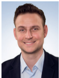
Moritz Schlanke Kommunikation