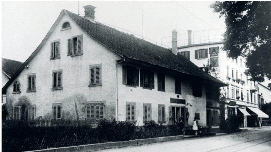
Ehemaliges Bauernhaus (Haus Kupfer) an der Bahnhofstrasse 12, danach Schuhmacher Kaltenberger und Lebensmittelladen Tenti; aufgenommen vor dem Abbruch 1929.

Über 100 Jahre lang prägte ein Goldschmiedegeschäft die Bahnhofstrasse in Uster – mit drei Inhabern, bewegter Geschichte und einer überraschenden Verbindung zu Thomas Mann.